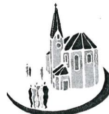
Mariä Himmelfahrt Kirchberg ( KB )

St. Michael Heilinghausen ( HH ) – St. Dionysius Hirschling ( HL ) Schloßkapelle St. Ulrich Karlstein ( KS ) und Spindlhof ( SH )